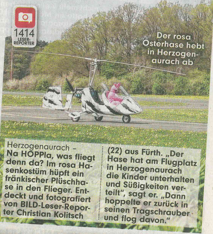
Der rosa Osterhase hebt in Herzogenaurach ab

Herzogenaurach – Na HOPPla, was fliegt denn da? Im rosa Hasenkostüm hüpfte ein fränkischer Plüschhase in den Flieger.